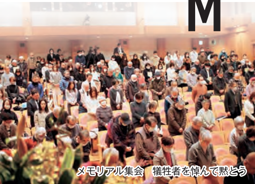
メモリアル集会 犠牲者を悼んで黙とう