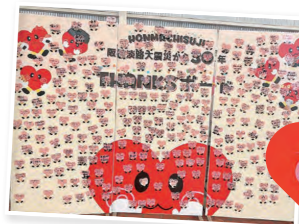
▲震災30年のTHANKSボードが！