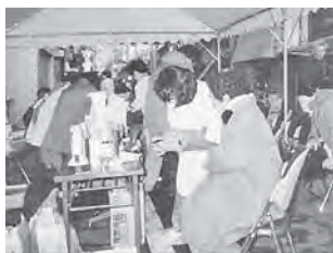
▲震災発生直後、病院前にはテントがはられ、けが人の処置を

建物倒壊による多数の死者 同時多発の火災が発生 私たち兵庫民医連の事業所は「地域の命と生活の砦」となり、職員も命がけだった