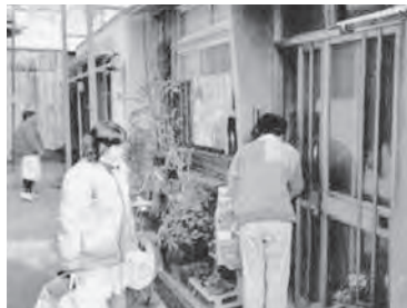
▲長田区南部全戸訪問ローラー作戦