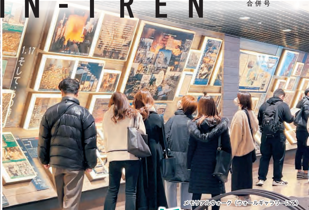
メモリアルウォーク（ウォールギャラリーにて）